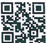
แบบใบเสนอชื่อ